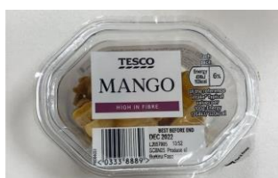
Figure 9 : Mangues séchées de Tesco