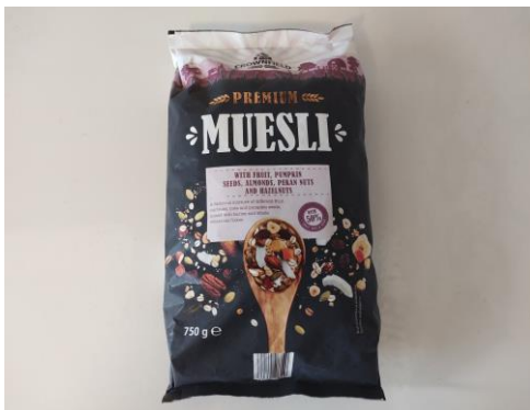
Figure 7 : Muesli premium contenant de la mangue séchée commercialisé par le détaillant allemand Lidl

Outre les en-cas et les barres de fruits mentionnés précédemment, la mangue séchée est un ingrédient important des mélanges de céréales pour le petit-déjeuner. Si la mangue confite était autrefois privilégiée, la mangue séchée naturelle devient plus attractive en raison de sa plus faible teneur en sucre. Un exemple de nouvel ingrédient croustillant sur le marché allemand est la manque lyophilisée de Koro, en provenance de Chine.