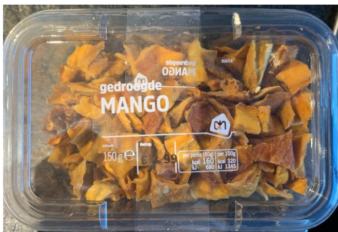
Figure 12 : Mangues séchées d'Albert Heijn