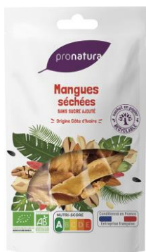
Figure 10 : Mangue séchée biologique de Pronatura