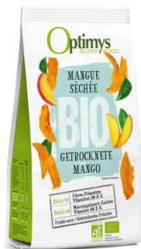
Figure 11 : Mangue séchée biologique d'Optimys