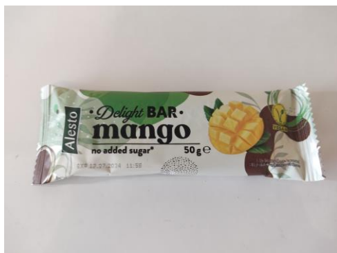
Figure 4 : Barre de fruits à la mangue séchée sans sucre ajouté, commercialisée par le discounter allemand Lidl

L'Allemagne est un marché particulièrement intéressant pour les mangues séchées, car le pays est le plus grand marché européen pour les aliments biologiques. De plus, les ventes de mangues séchées sans sucre ajouté et sans conservateurs sont en pleine progression. L'un des segments du marché offrant des opportunités spécifiques aux fournisseurs de mangue séchée est celui des barres de fruits. On observe un nombre croissant de lancements de barres de fruits et d'en-cas similaires contenant des mangues séchées. Les enseignes Alnatura , Rosmann et dm-drogerie markt en sont des exemples notables. Toutefois, il convient de noter que certaines barres de fruits contenant de la mangue sont produites à partir de purées de mangue et non de mangue séchée.