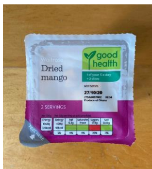
Figure 8 : Tranches de mangue séchée de Waitrose