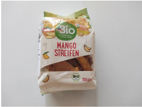
Figure 6 : Morceaux de mangue séchée commercialisés par l'enseigne allemande dm-drogerie