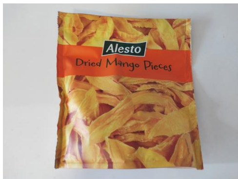
Figure 5 : Morceaux de mangue séchée commercialisés par le discounter allemand Lidl

En Allemagne, d'importantes quantités de mangues séchées sont vendues sous marque de distributeur. Parmi celles-ci figurent des marques telles que Alesto (détenue par la chaîne de discounter Lidl ), REWE Beste Wahl ( REWE ), dmBio ( dm-drogerie markt ) et EDEKA ( EDEKA ). Parallèlement, il existe des marques indépendantes allemandes telles que Seeberger , Farmer's Snack , Kluth , Märsch et WeltPartner . Seeberger, Kluth et Farmer's Snack importent directement, tout en s'approvisionnant également auprès d'autres négociants en Allemagne et aux Pays-Bas. Le format de vente au détail le plus vendu est la tranche.