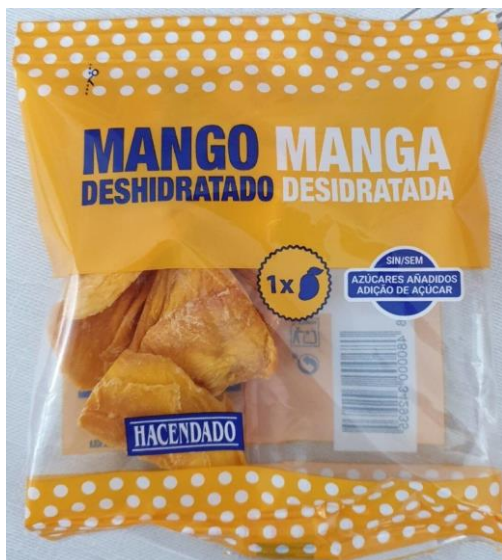
Figure 13 : Mangue séchée sous marque de distributeur (Mercadona)