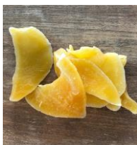
Figure 1 : Morceaux de mangue séchée